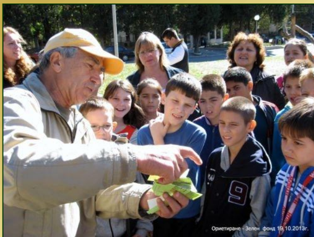
Ориентиране - Зелен фонд 19.10.2013г.